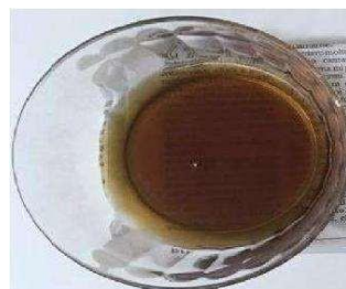
Preparazione NON ADEGUATA

Un semplice metodo per essere certi dell'efficacia della preparazione assunta è verificare che le ultime evacuazioni siano liquide e di colore chiaro.